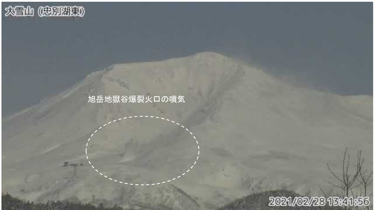
図2 大雪山 西側から見た旭岳の状況（2月28日、 ちゅうべつこひがし 忠別湖東監視カメラによる）