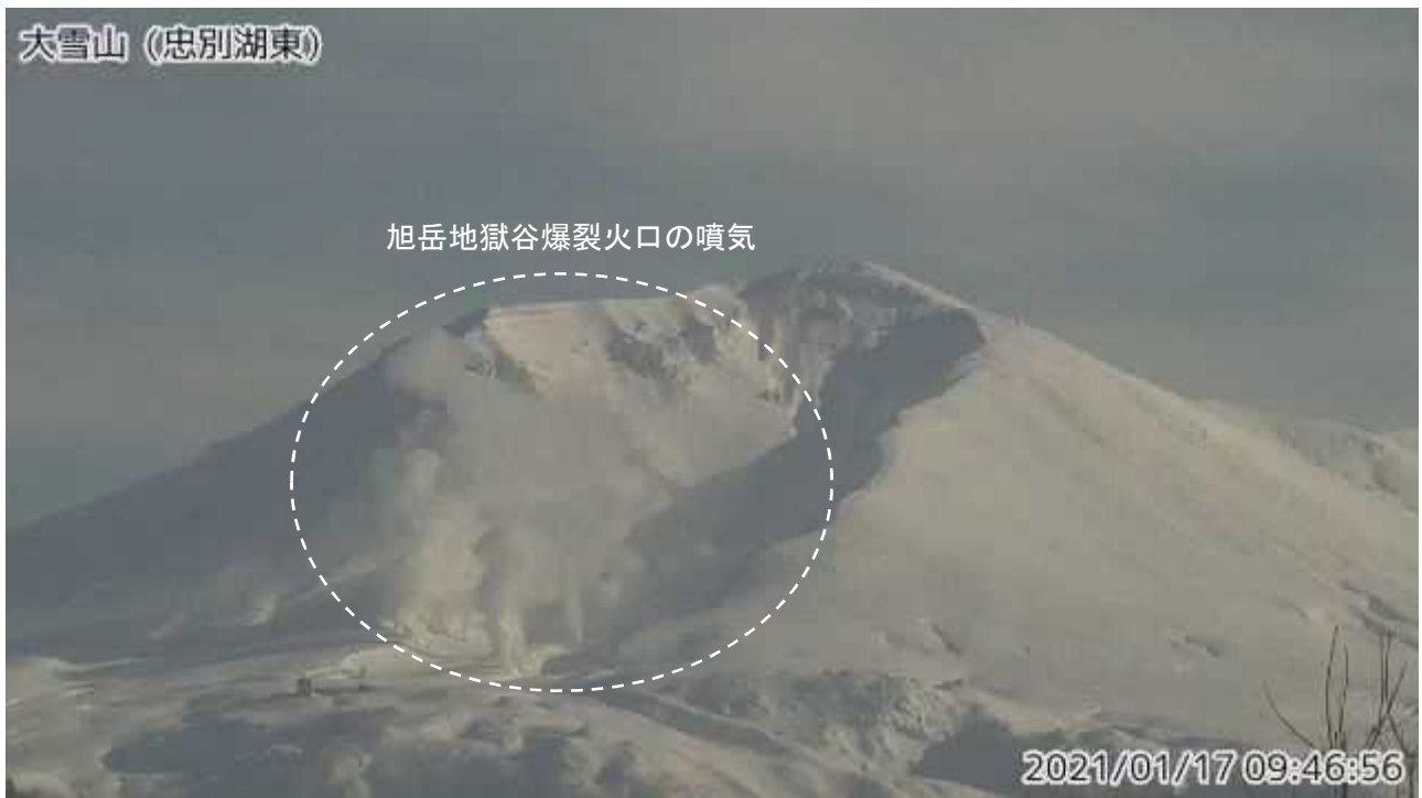
図2 大雪山 西側から見た旭岳の状況（1月17日、忠別湖東監視カメラによる）