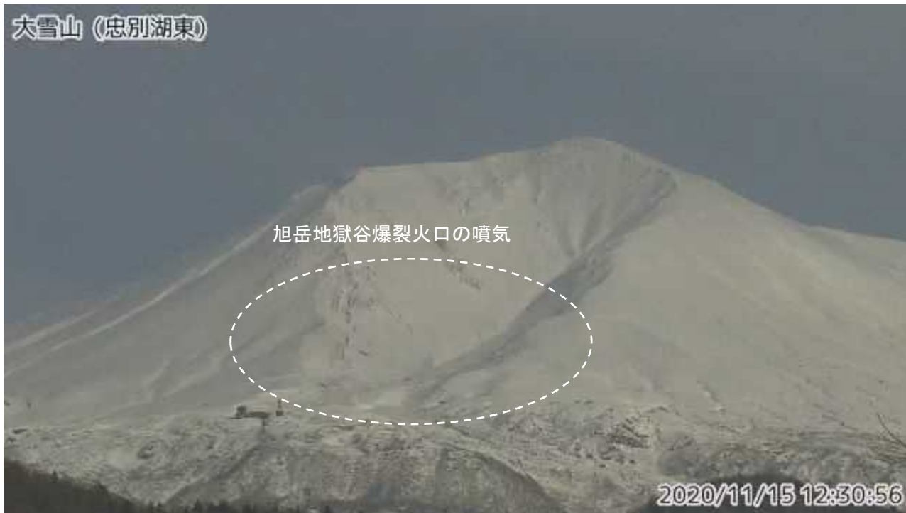
図2 大雪山 西側から見た旭岳の状況（11月15日、忠別湖東監視カメラによる）