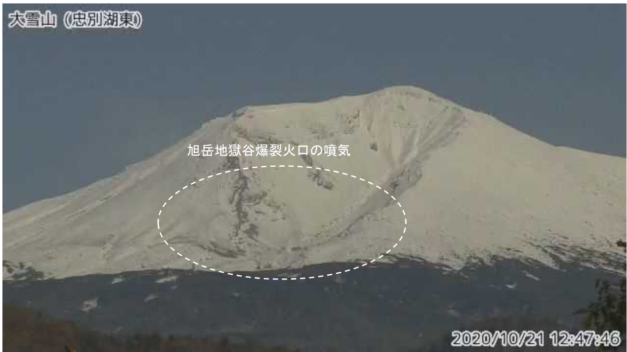
図2 大雪山 西側から見た旭岳の状況（10月21日、 ちゅうべつこひがし 忠別湖東監視カメラによる）