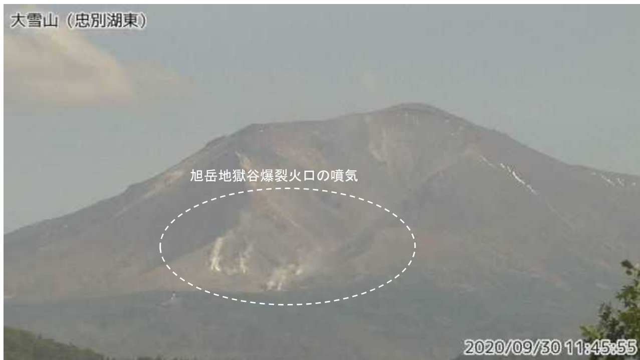
図2 大雪山 西側から見た旭岳の状況（9月30日、忠別湖東監視カメラによる）