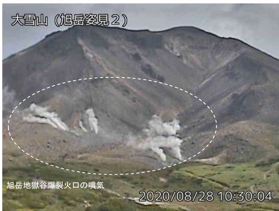
図2 大雪山 西側から見た旭岳地獄谷爆裂火口の状況（8月28日、 あさひだけがたみ 旭岳姿見2監視カメラによる）