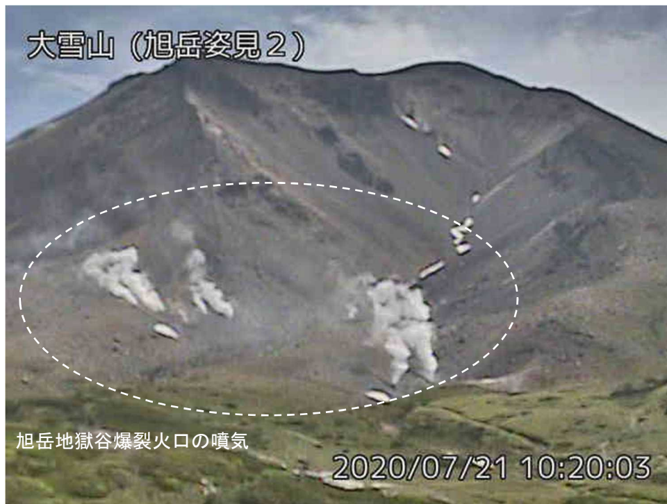
図2 大雪山 西側から見た旭岳地獄谷爆裂火口の状況 (7月21日、 あさひだけがたみ 旭岳姿見2監視カメラによる)