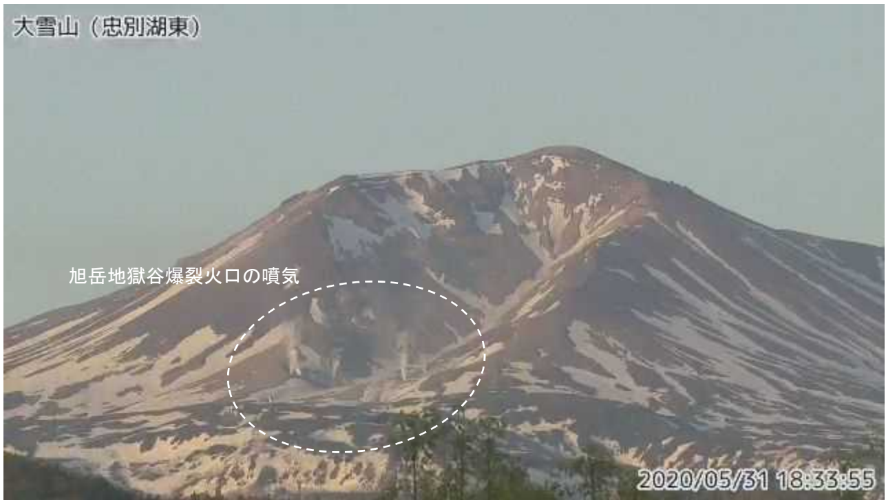
図2 大雪山 西側から見た旭岳の状況（5月31日、忠別湖東監視カメラによる）