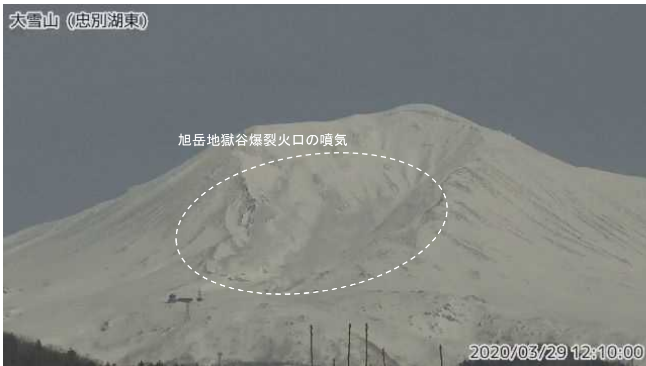
図2 大雪山 西側から見た旭岳の状況 (3月29日、忠別湖東監視カメラによる)