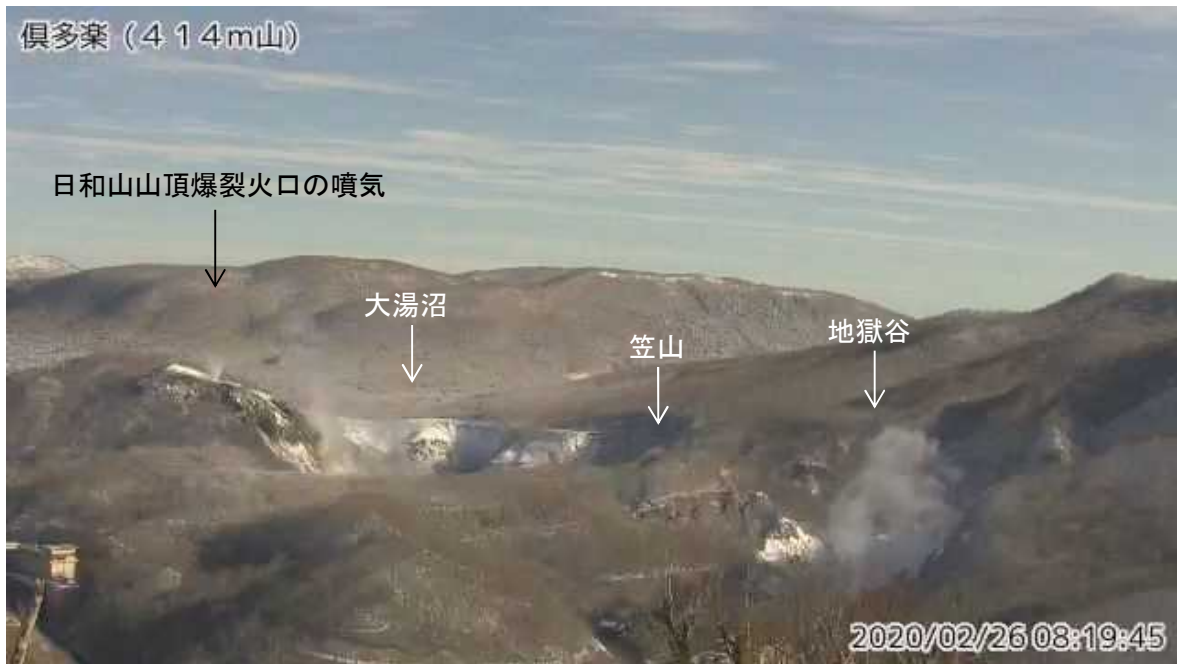
図1 倶多楽 南南西側から見た日和山、大湯沼及び地獄谷周辺の状況 (2月26日、414m山監視カメラによる)