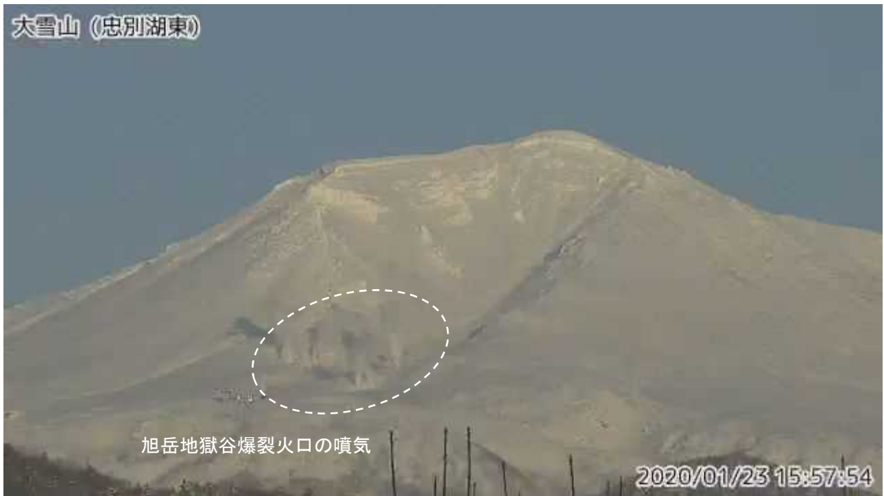
図2 大雪山 西側から見た旭岳の状況（1月23日、 ちゅうべつこひがし 忠別湖東 監視カメラによる）