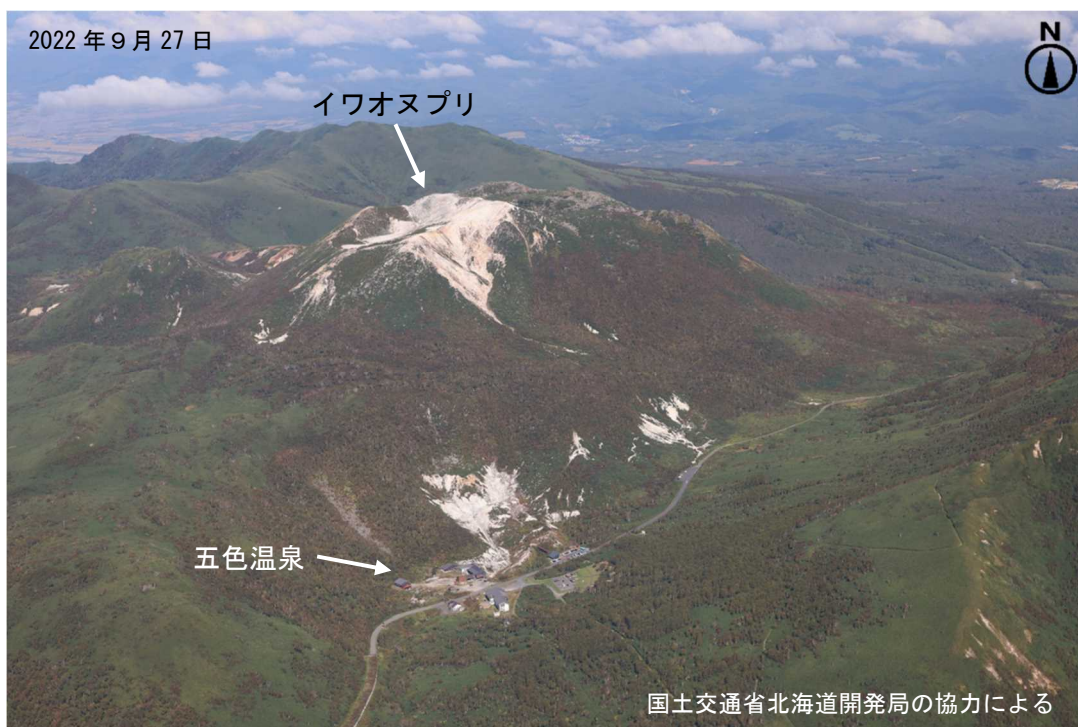
図2 ニセコ イワオヌプリ及び五色温泉周辺の状況 南側上空(図1の①)から撮影