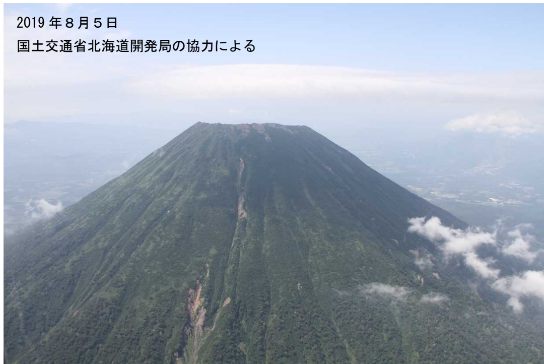
図 2 羊蹄山 山体の状況 東側上空（図 1 の①）から撮影