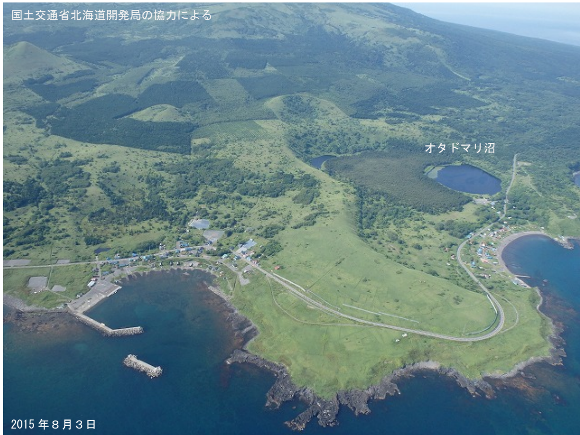
図 2 利尻山 オタドマリ沼周辺の状況 図 1 - ①から撮影