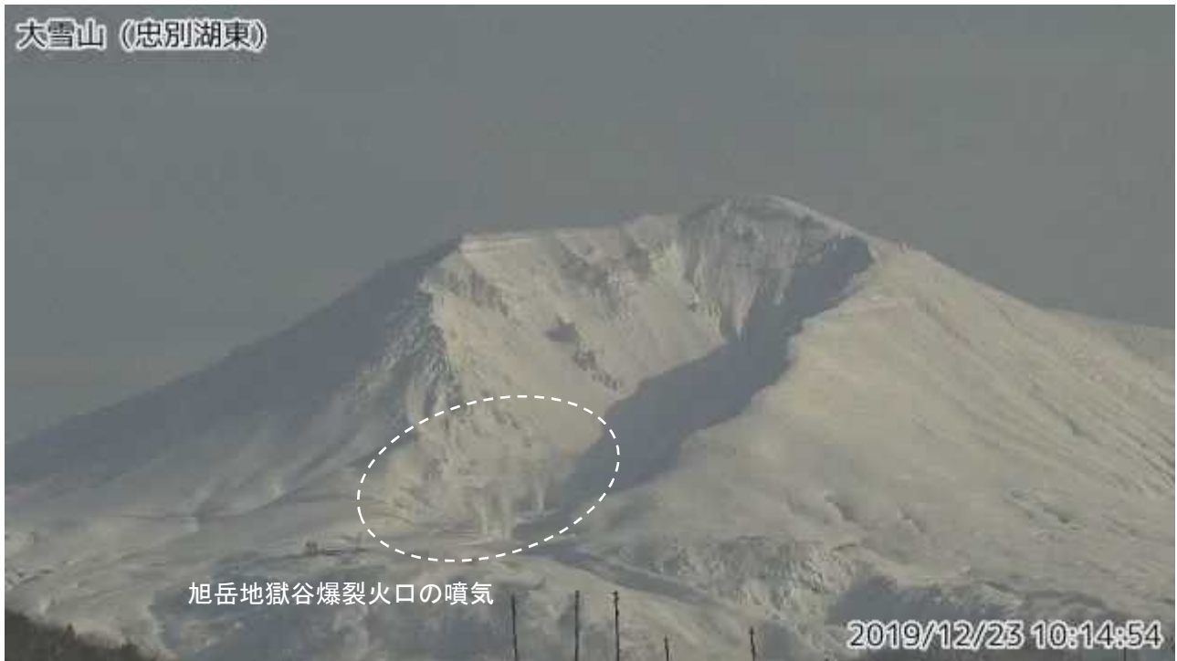
図2 大雪山 西側から見た旭岳の状況（12月23日、 ちゅうべつこひがし 忠別湖東 監視カメラによる）