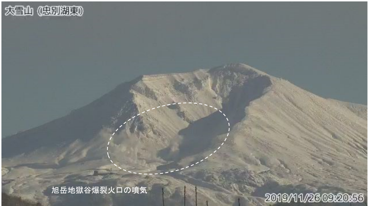
図2 大雪山 西側から見た旭岳の状況（11月26日、 ちゅうべつこひがし 忠別湖東監視カメラによる）