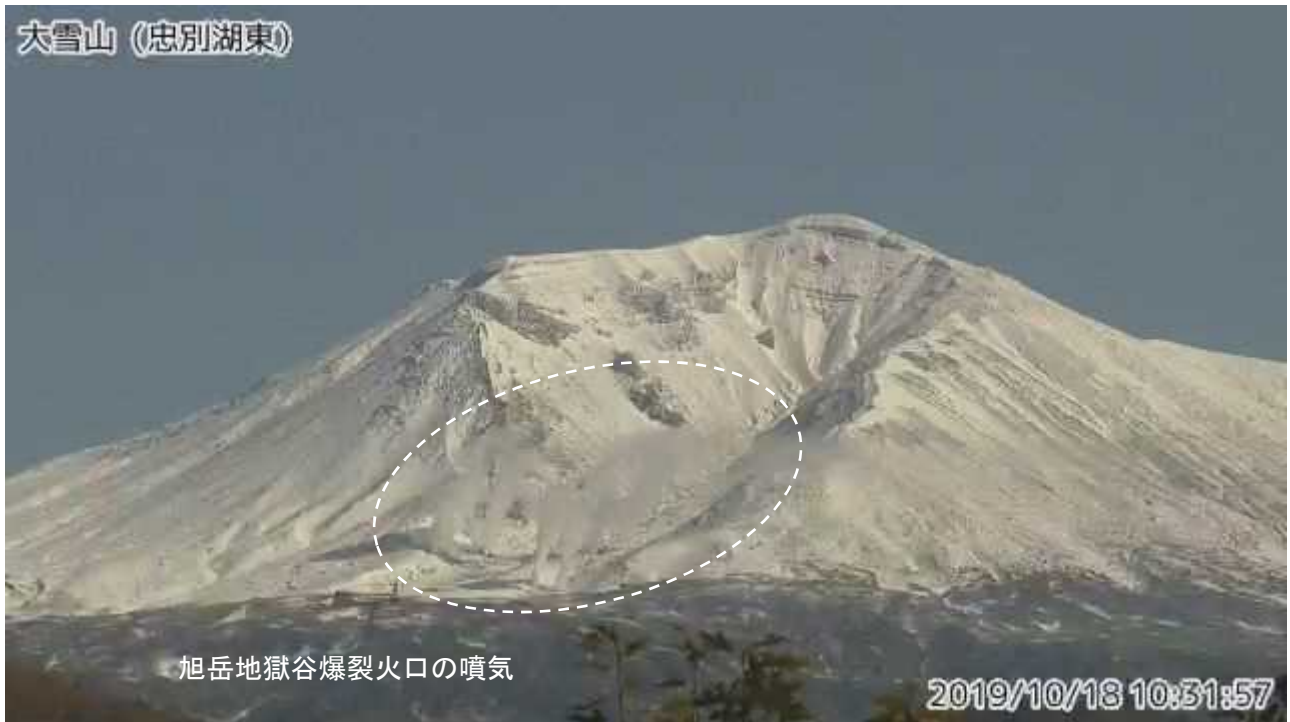
図2 大雪山 西側から見た旭岳の状況（10月18日、 ちゅうべつこひがし 忠別湖東監視カメラによる）