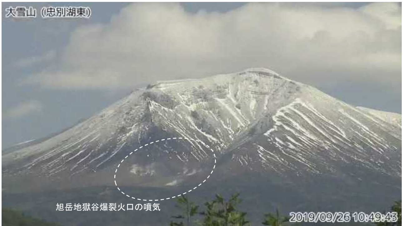
図2 大雪山 西側から見た旭岳の状況（9月26日、忠別湖東監視カメラによる）