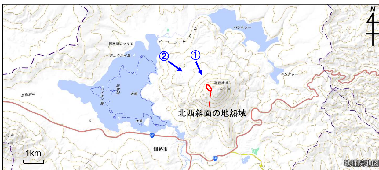
図1 雄阿寒岳 周辺図と写真及び赤外熱映像の撮影方向（矢印）

29日に上空からの観測（国土交通省北海道開発局の協力による）を実施しました。昨年の観測（11月27日、7月30日）と比較して北西斜面の弱い地熱域の状況に変化はみられませんでした。