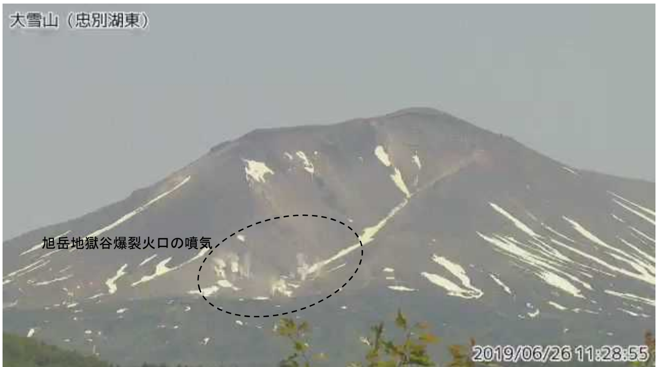
図2 大雪山 西側から見た旭岳の状況（6月26日、忠別湖東監視カメラによる）