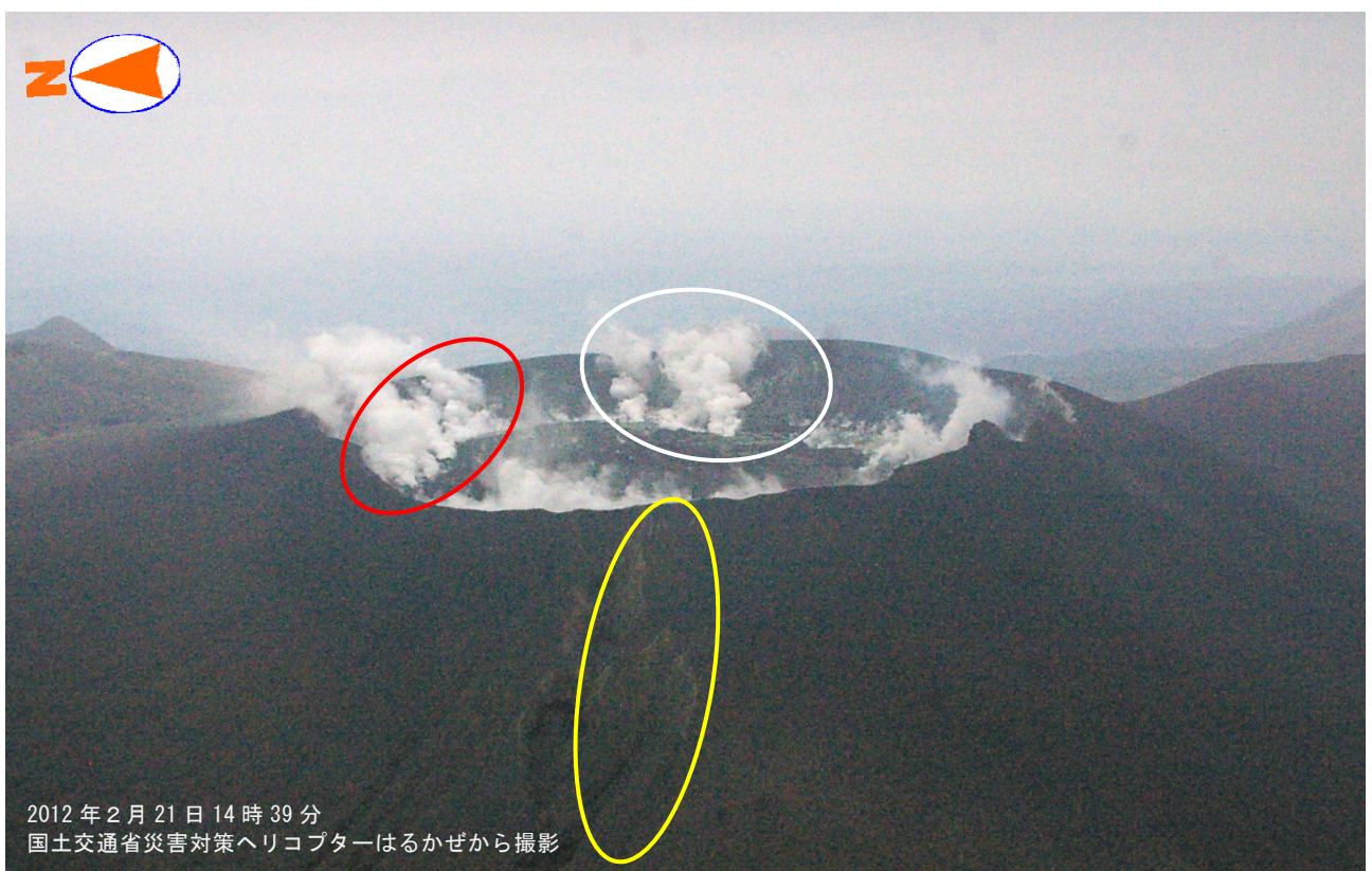
図1 霧島山（新燃岳） 火口内の状況