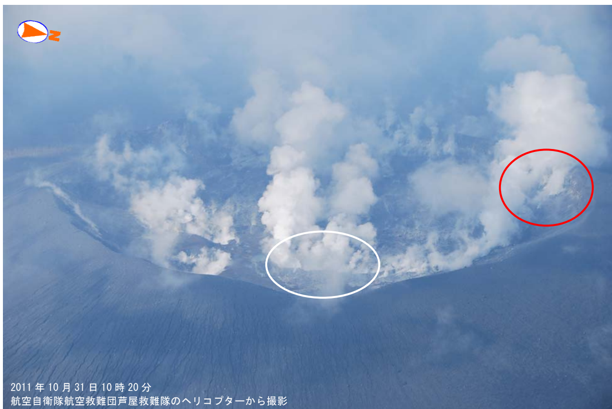
図1 霧島山（新燃岳） 火口内の状況