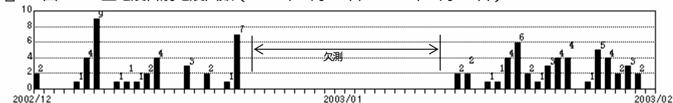
図3 A型地震日別地震回数(2002年12月1日～2003年1月31日)