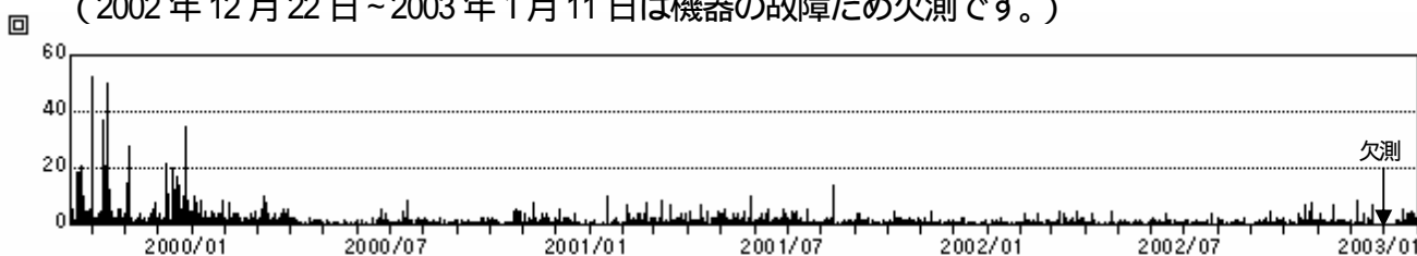
図1 A型地震日別地震回数(1999年9月12日～2003年1月31日)