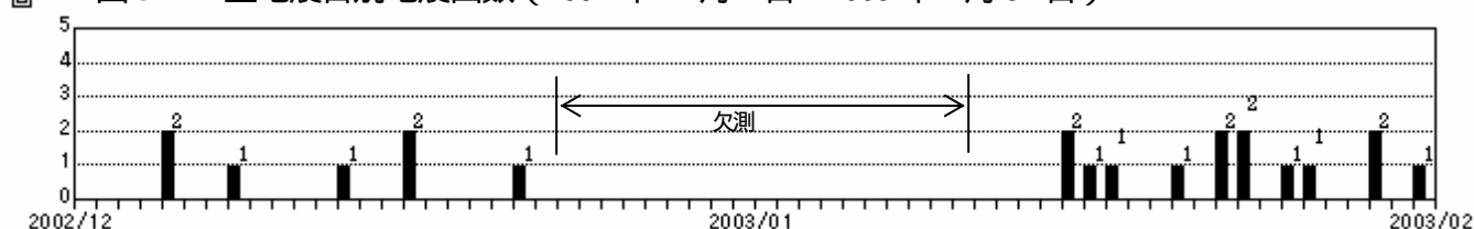
図4 B型地震日別地震回数(2002年12月1日～2003年1月31日)