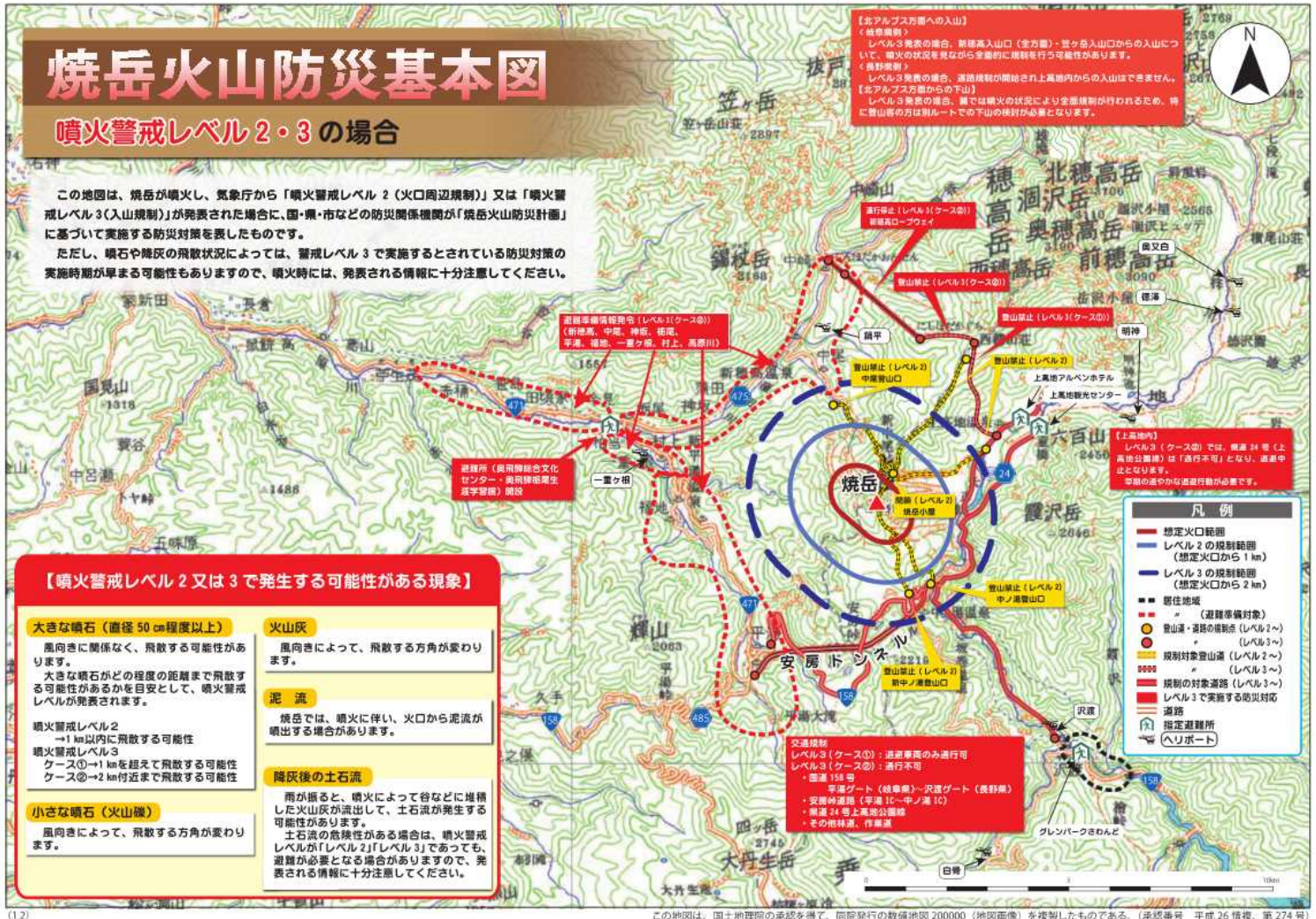
図1 焼岳火山防災基本図(噴火警戒レベル2・3の場合)