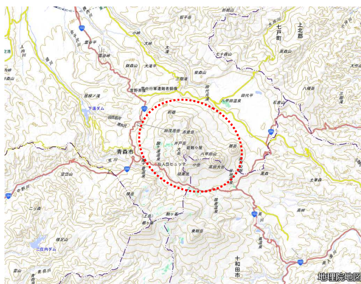
図3 火山性地震の領域