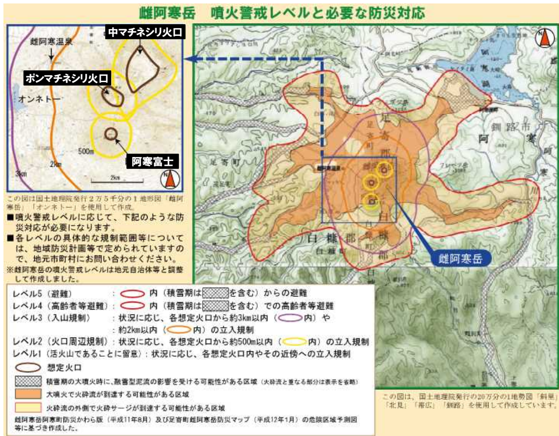
図1 雌阿寒岳の想定火口、影響範囲及び必要な防災対応 (噴火警戒レベルリーフレットより)