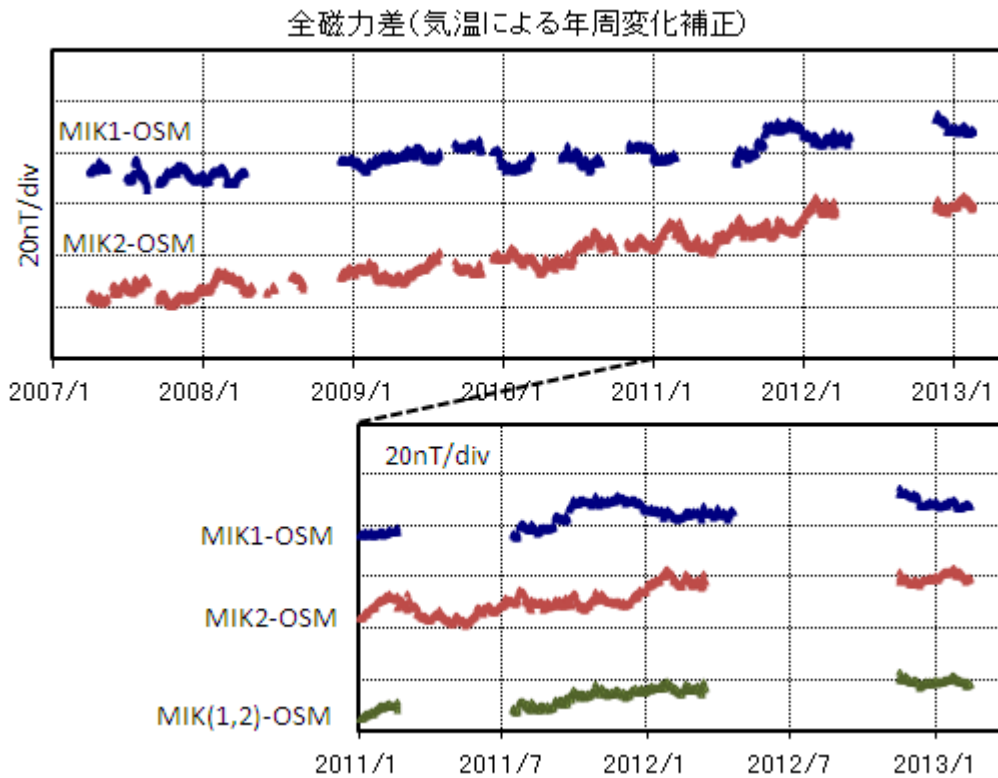
第3図 気温補正後の全磁力日平均値差（上図：期間2007年3月～2013年2月、下図：期間2011年1月～2013年2月、下図緑色：MIK1とMIK2の平均値の全磁力差MKI(1,2)-OSM）