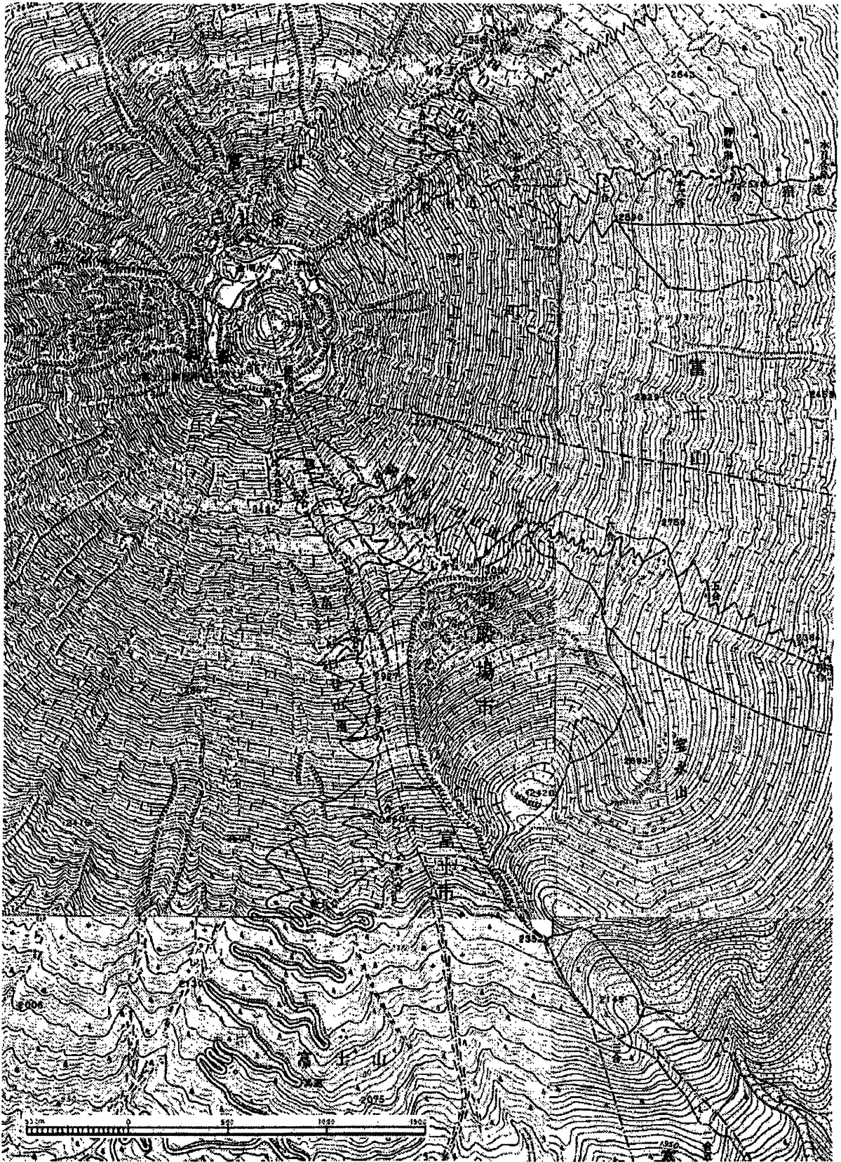
図1 富士山の地形図

国土地理院発行地形図 1:25,000 「富士山」「須走」「天母山」「印野」を使用。