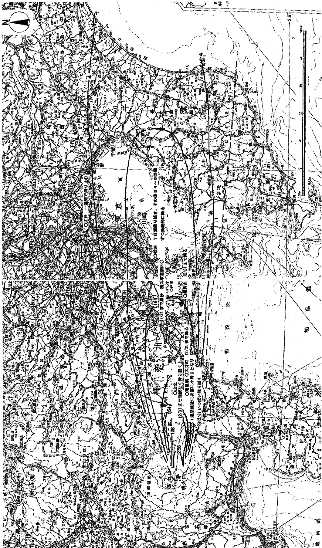
図4 現時点での宝永噴火による堆積物の厚さ

損害保険料率算定会(1997)の図(国土地理院発行1:500,000地方図「関東甲信越」を基図として、宮地の資料により国土庁(1991)が編集した宝永スコリア全層の等厚線図上に、下巻(1981)を基にした宝永噴火停止までの各地の状況を重ねた図)の記述を修正。等厚線図に示した層厚の単位はcm。