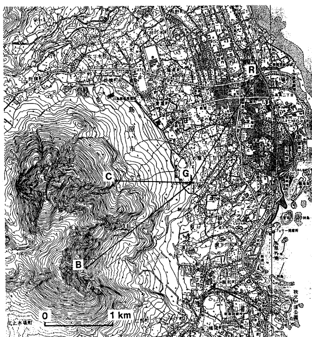
第1図 眉山東斜面の光波測距観測網 Fig.1 EDM network around Mayu-yama.

本年4月に、自動連続測距に使用してきた測定機器が故障したが、8月には正常に復帰した。