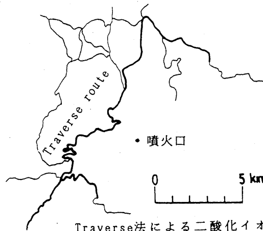
Traverse法による二酸化イオウ 積算濃度測定ルート