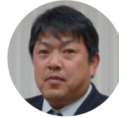
大西 勝也 黒潮町町長