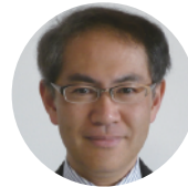
矢守 克也 京都大学防災研究所教授