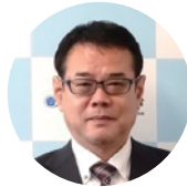
出宮 稔 高知地方気象台長