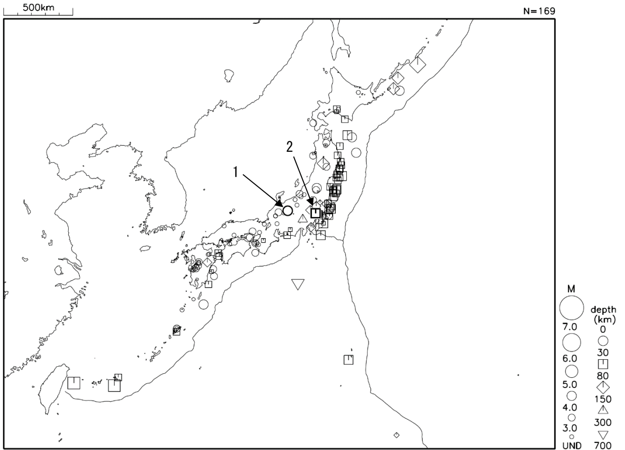
図2 令和2年7月に震度1以上を観測した地震（図中の番号は、表の番号に対応）