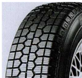
スタッドレスタイヤ