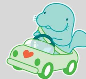
NEXCO東日本 マナーアップキャラクター「マナーティ」

冬道で安全に走行するためには溝の深さが新品から50%程度摩耗したタイミング(5.0mm)が交換時期です。