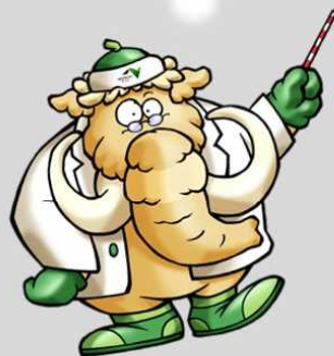
雪道研究家 マンモシ博士