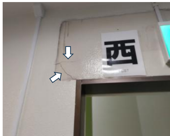
写真 2 壁の亀裂（おいらせ町上明堂）