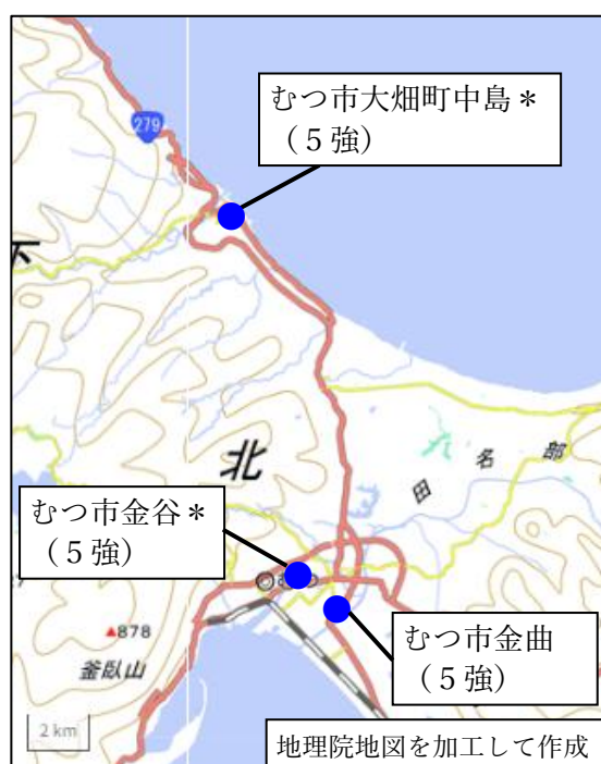
図 2 領域 A 詳細図