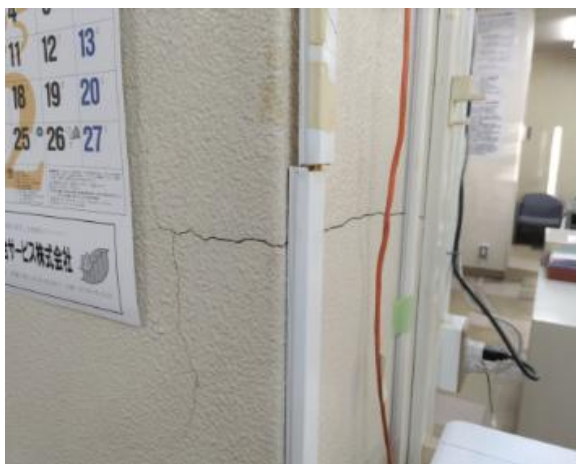
写真 1 壁の亀裂（おいらせ町上明堂）