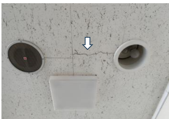
写真 3 天井の亀裂（おいらせ町上明堂）