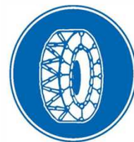
チェーン規制標識 「タイヤチェーンを取り付けていない 車両通行止め」

「チェーン規制」を実施する際は、規制実施区間の手前に上記の標識が掲示されますので、規制区間を走行される方は「チェーン」の装着をお願いします。