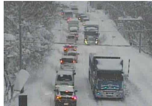
【写①】R3.12.27 国道4号の交通混雑状況