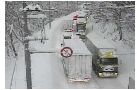
【写②】R3.12.28 国道7号の交通混雑状況