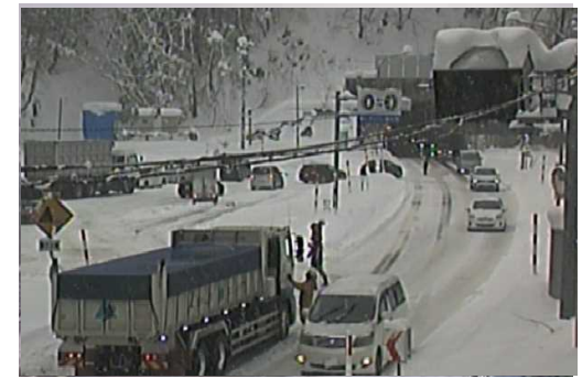
【写④】R3.12.28 国道13号の交通混雑状況