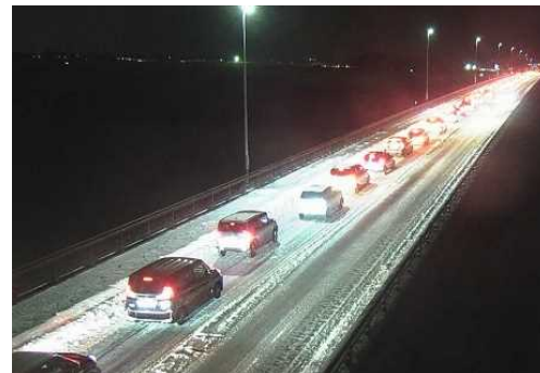
【写③】R4.1.4 国道7号の交通混雑状況