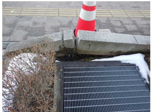
写真10：歩道の縁石部分の破損（福島県福島市）