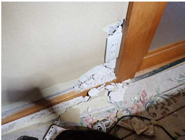
写真9：家屋の内壁の破損（宮城県東松島市）