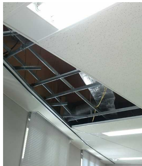
写真12：建物天井の落下（福島県富岡町）