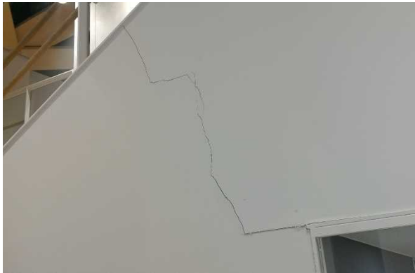
写真 13 : 階段の壁の亀裂 (福島県大熊町)