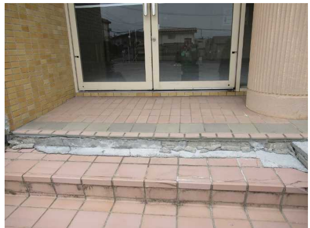
写真6：建物入口の階段部分の破損（宮城県大崎市）