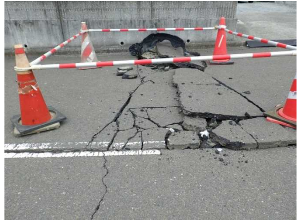
写真8：アスファルト路面の破損（宮城県山元町）