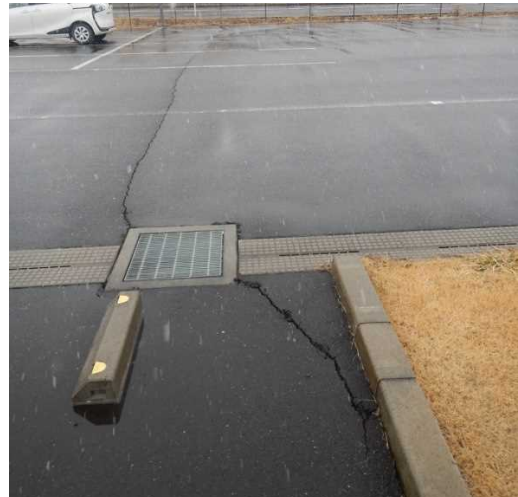
写真4：アスファルト路面の亀裂（宮城県栗原市）