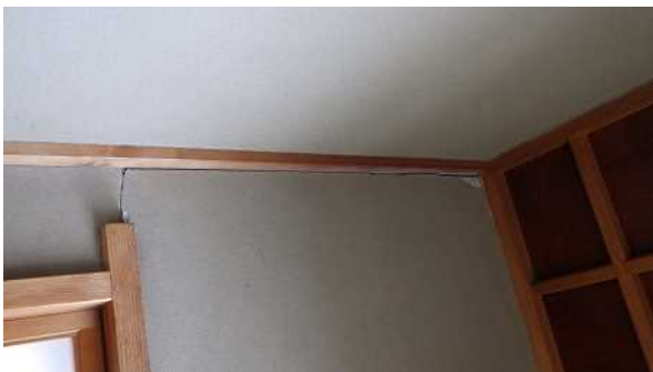
写真5：家屋の内壁の破損（宮城県大崎市）