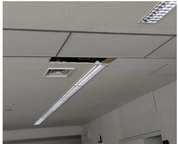
写真 14 : 建物天井の落下 (福島県新地町)