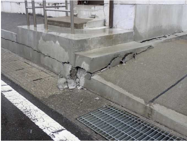
写真1：建物脇の段差部分の破損（宮城県涌谷町）