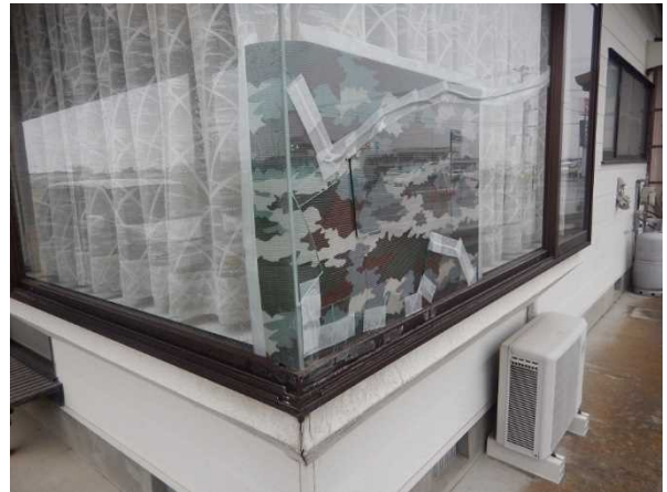
写真2：窓ガラスの破損（宮城県栗原市）