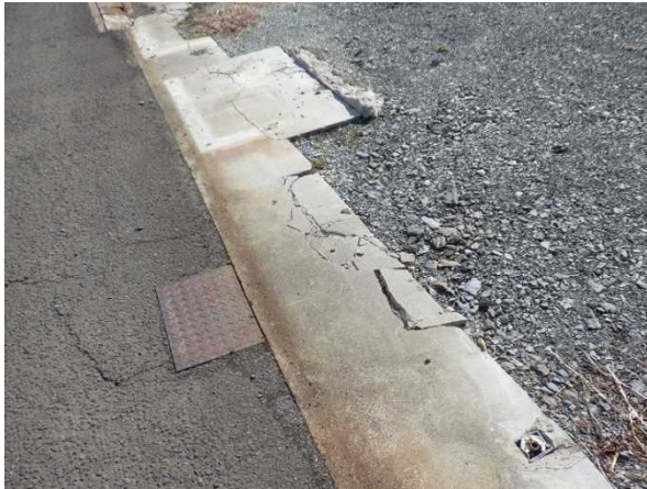
写真7：道路脇のコンクリート部分の亀裂（宮城県角田市）