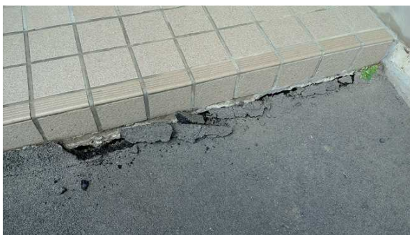
写真11：建物入口のアスファルト路面の破損（福島県楡葉町）