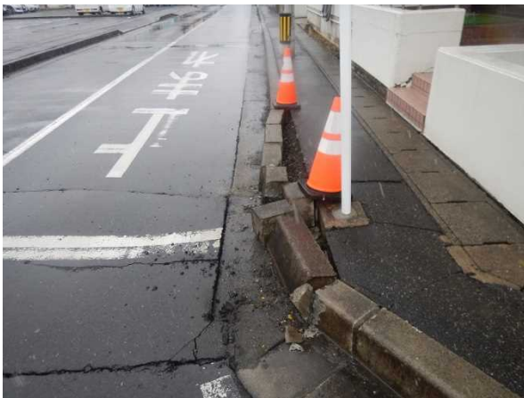
写真3：歩道の段差部分の破損、アスファルト路面の亀裂（宮城県栗原市）