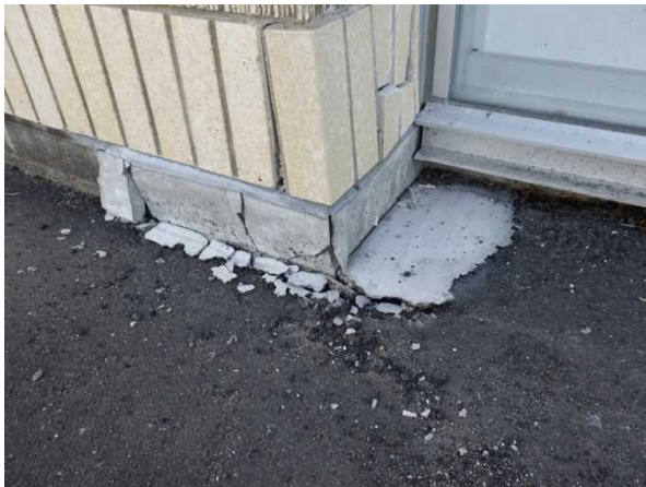
写真 15 : 建物外壁の破損 (福島県新地町)