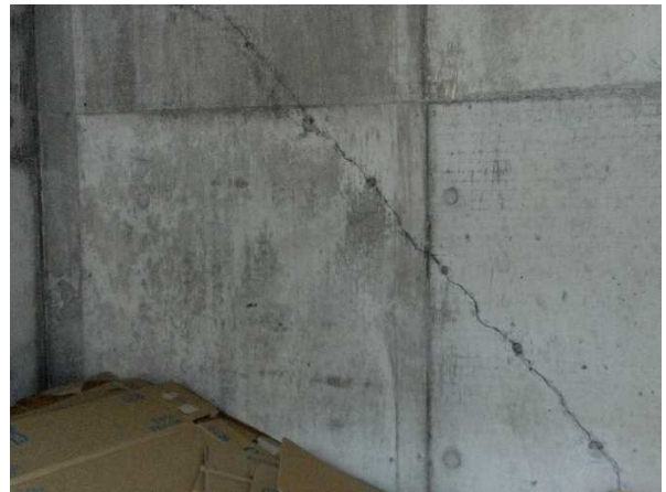
写真 16 : 倉庫の内壁の亀裂 (福島県南相馬市)