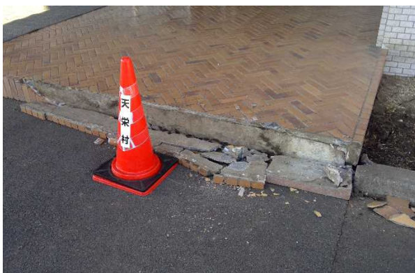
写真11：建物玄関段差部分の破損（福島県天栄村）