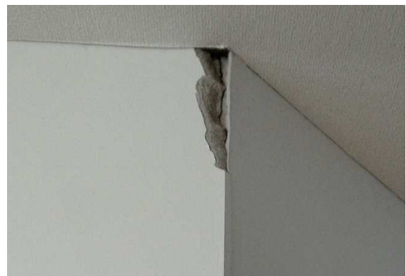
写真12：内壁の破損（福島県川内村）