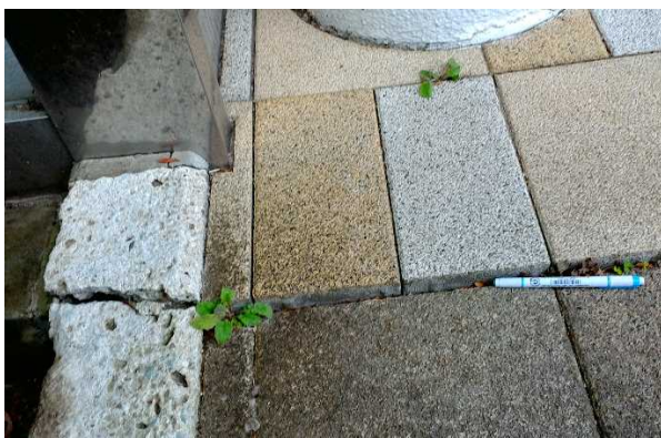
写真9：建物入口の床材の隆起および亀裂（福島県南相馬市）