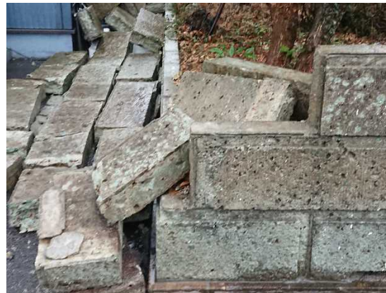
写真 6 : 民家の塀の倒壊 (福島県郡山市)