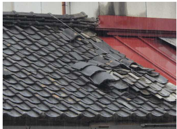
写真10：瓦のずれ（福島県川俣町）