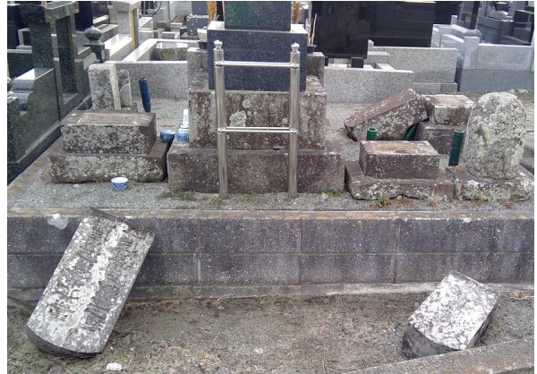
写真 2 : 墓石の転倒 (宮城県岩沼市)