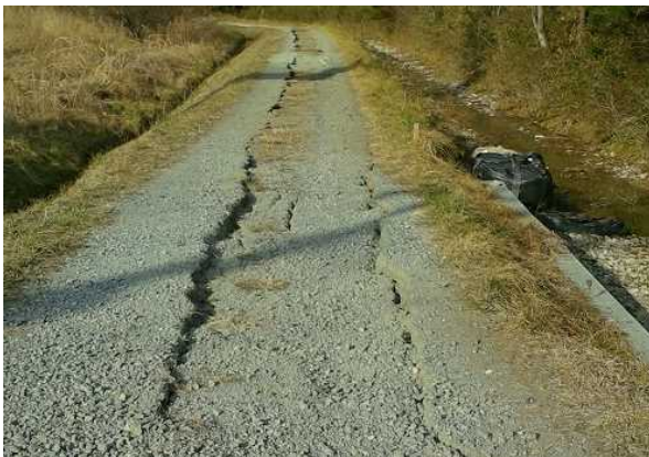
写真 5 : 農道の亀裂 (宮城県山元町)