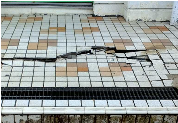
写真 1 : 建物玄関の床タイルの破損 (宮城県石巻市)