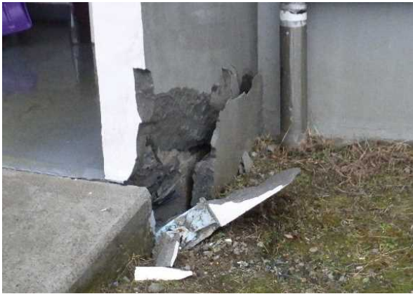
写真 3 : 建物入口の壁の損壊 (宮城県登米市)