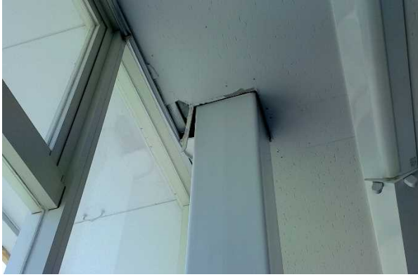
写真 13 : 天井の破損（福島県浪江町）