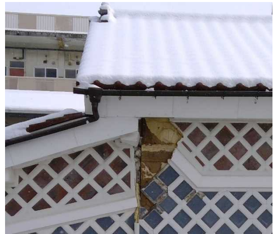
写真8：壁の損壊（福島県須賀川市）