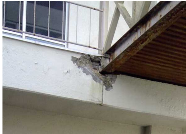
写真 4 : 壁の損壊 (宮城県川崎町)