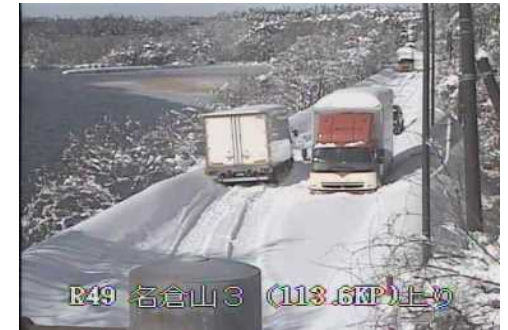
【国道49号猪苗代町の状況】