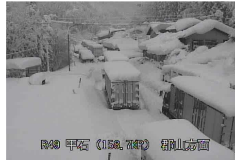
【国道49号西会津町の状況】