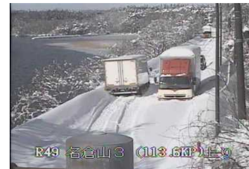
【国道49号猪苗代町の状況】