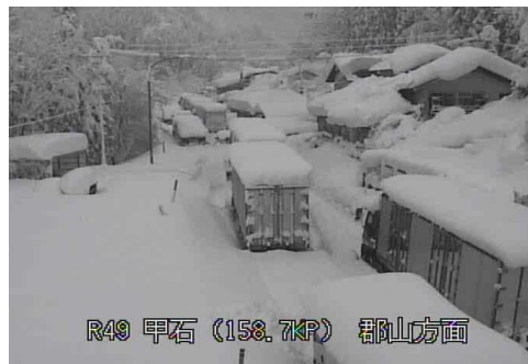
【国道49号西会津町の状況】