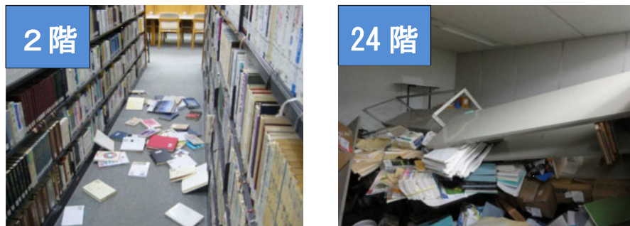
図2 同じビルの高階層と低階層での被害の違い

図2は「平成23年（2011年）東北地方太平洋沖地震」の際の東京都内にあるビル内の様子です。このように、長周期地震動により高層階は大きく揺れ、低層階よりも家具類や什器が転倒・移動し被害が発生しやすくなります。この他にも、天井の落下やスプリンクラーやエレベーターの故障等の被害が発生しました。