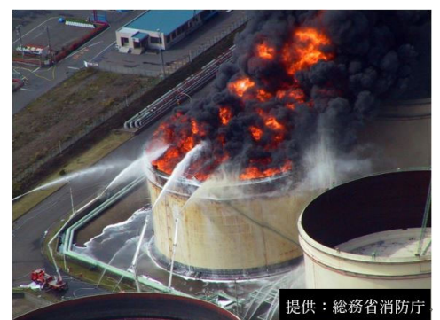
図3 大型タンク類の被害

地表の揺れが収まっても、高層階では大きなゆっくりとした揺れが10分以上続く場合もあります。長周期地震動も通常の地震の揺れも、身を守る行動は同じです。大きな揺れや強い揺れを感じたと