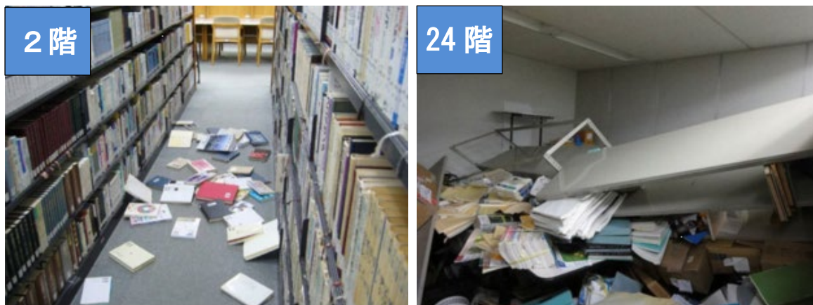
図2 東京都内の同じビル内での被害の違い

図2は「平成23年（2011年）東北地方太平洋沖地震」の際の東京都内のビル内の様子です。このように、長周期地震動によりビルの高層階は大きく揺れ、低層階よりも家具類の転倒などの被害が発生しやすくなります。この他にも、天井の落下やスプリンクラーの故障、エレベーターの障害などの被害が発生しました。