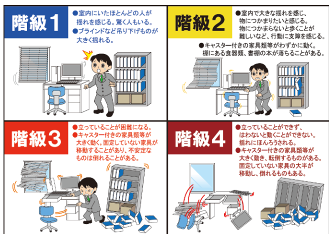
図3 長周期地震動階級

長周期地震動に関する情報としては、緊急地震速報で揺れの予想を、「長周期地震動に関する観測情報」で観測結果をお伝えします。緊急地震速報（警報）は、震度5弱以上を予想した場合に加え、長周期地震動階級3以上を予想した場合に発表します。緊急地震速報を見聞きしたら、あわてず、まず身の安全を守る行動をとって下さい。また、実際に観測した長周期地震動階級などは、地震発生から10分程度で「長周期地震動に関する観測情報」をオンライン配信するとともに気象庁ホームページ（ https://www.jma.go.jp/bosai/map.html#contents=ltpgm ）でも公開しています（図4）。