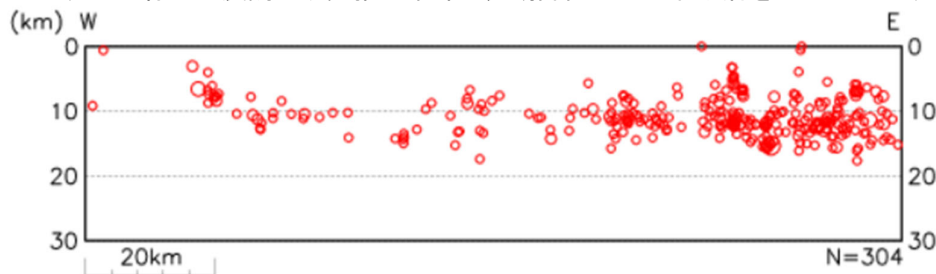
図2 断面図(2026年5月1日~31日、深さ30km以浅) 震央分布図を南の方から見た断面図です。

本資料は、国立研究開発法人防災科学技術研究所、北海道大学、弘前大学、東北大学、東京大学、名古屋大学、京都大学、高知大学、九州大学、鹿児島大学、国立研究開発法人産業技術総合研究所、国土地理院、国立研究開発法人海洋研究開発機構、公益財団法人地震予知総合研究振興会、青森県、東京都、静岡県、神奈川県温泉地学研究所及び気象庁のデータを用いて作成しています。また、2016年熊本地震合同観測グループのオンライン臨時観測点(河原、熊野座)、2022年能登半島における合同地震観測グループによるオンライン臨時観測点(よしが浦温泉、飯田小学校)、2025年トカラ列島近海における合同地震観測グループによるオンライン臨時観測点(平島、小宝島)、EarthScope Consortiumの観測点(台北、玉峰、寧安橋、玉里、台東)のデータを用いて作成しています。