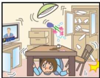
頭を守って、安全な場所に避難！

緊急地震速報を見聞きしたときの行動は、まわりの人に声をかけながら「周囲の状況に応じて、あわてずに、まず身の安全を確保する」ことが基本です。