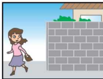
危ない場所から離れて！