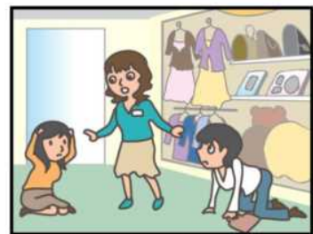
お店では、あわてず 係員の指示に従って！

詳しくは気象庁ホームページをご覧ください。 緊急地震速報 訓練 https://www.data.jma.go.jp/eww/data/nc/kunren/2023/02/kunren.html