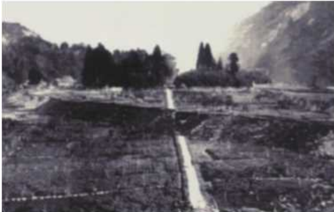
気象庁パンフレット「活断層に備える」から引用

東京大学地震研究所所蔵の「濃尾地震について」に大阪府内の様子を記した資料や新聞社の取材など数多くある。その中の1つの概要を記す。