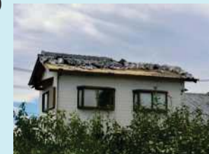
突風被害例 (住家の屋根瓦の飛散)