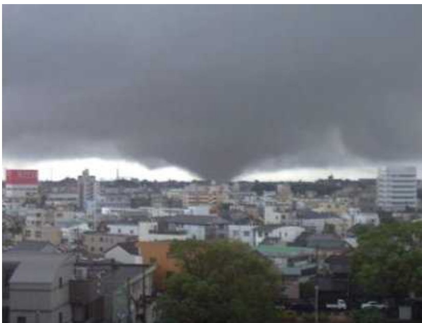
豊橋市内を移動する竜巻 (平成11年9月24日)