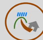
Tai họa sạt lở đất