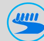
Tai họa ngập lụt