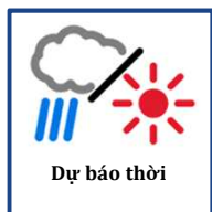
Dự báo thời