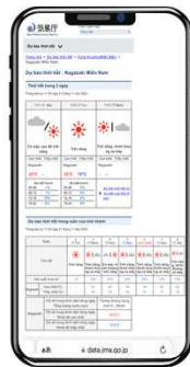
Trang chủ > Mưa sắp đến