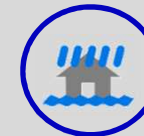
Tai họa lũ lụt