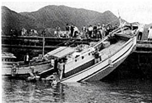
表 九州、山口県で発生した近年の「あびき」による主な被害事例

写真 1979年3月31日の長崎県福江島富江港での船舶乗揚げ被害（西部海難防止協会「津波（長崎港アビキ）対策調査委員会報告書」（昭和57年3月）より）