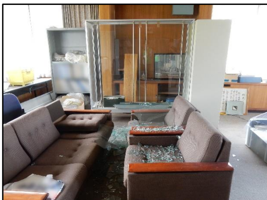
写真3 ガラスの破損（八戸市南郷）