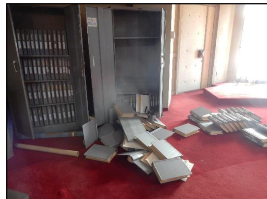
写真4 書籍の散乱（八戸市南郷）