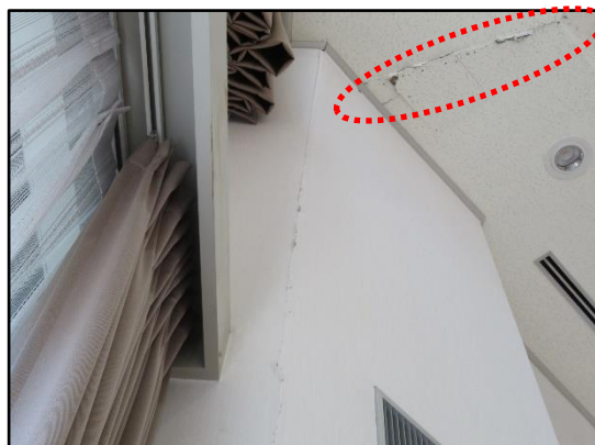
写真2 天井材の落下（階上町道仏）